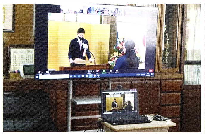
オンラインによる表彰式 文部科学省

これからも、この喜びを更なる飛躍の糧に今日的な教育課題に寄り添い、子育て支援とつながりのある地域づくりにより一層寄与していきたいと思ひます。