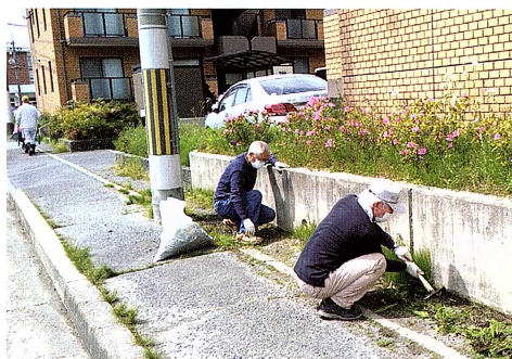
除草作業(ミッションクラブ)

今まで、梅雨時になると草が伸び、雨が降るたびに子どもたちの足元を濡らし不快な思いをさせていましたが、快適に登下校できるようにと昨年来より除草作業をして下さっているものです。