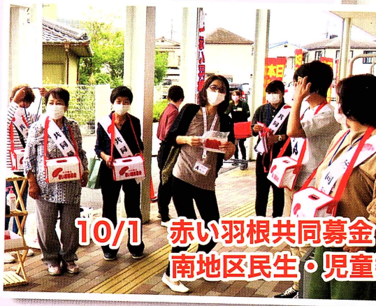
10/1 赤い羽根共同募金 南地区民生・児童委員による街頭運動

新型コロナウイルスの感染が収まらない中、いろいろ制約を受けながらの活動となりました。