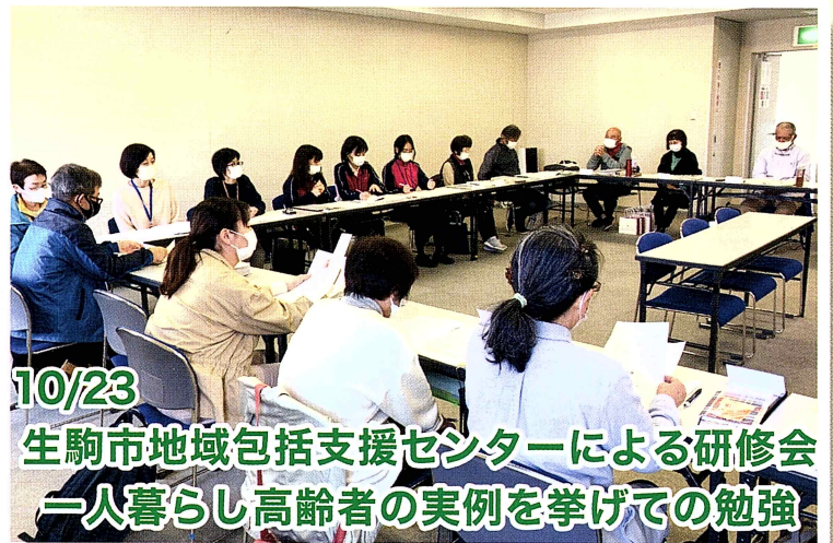
10/23 生駒市地域包括支援センターによる研修会 一人暮らし高齢者の実例を挙げての勉強