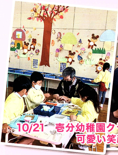
10/21 喜分幼稚園クラフト教室のお手伝い 可愛い笑顔に癒されます～