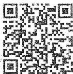
(ホームページ QRコード)