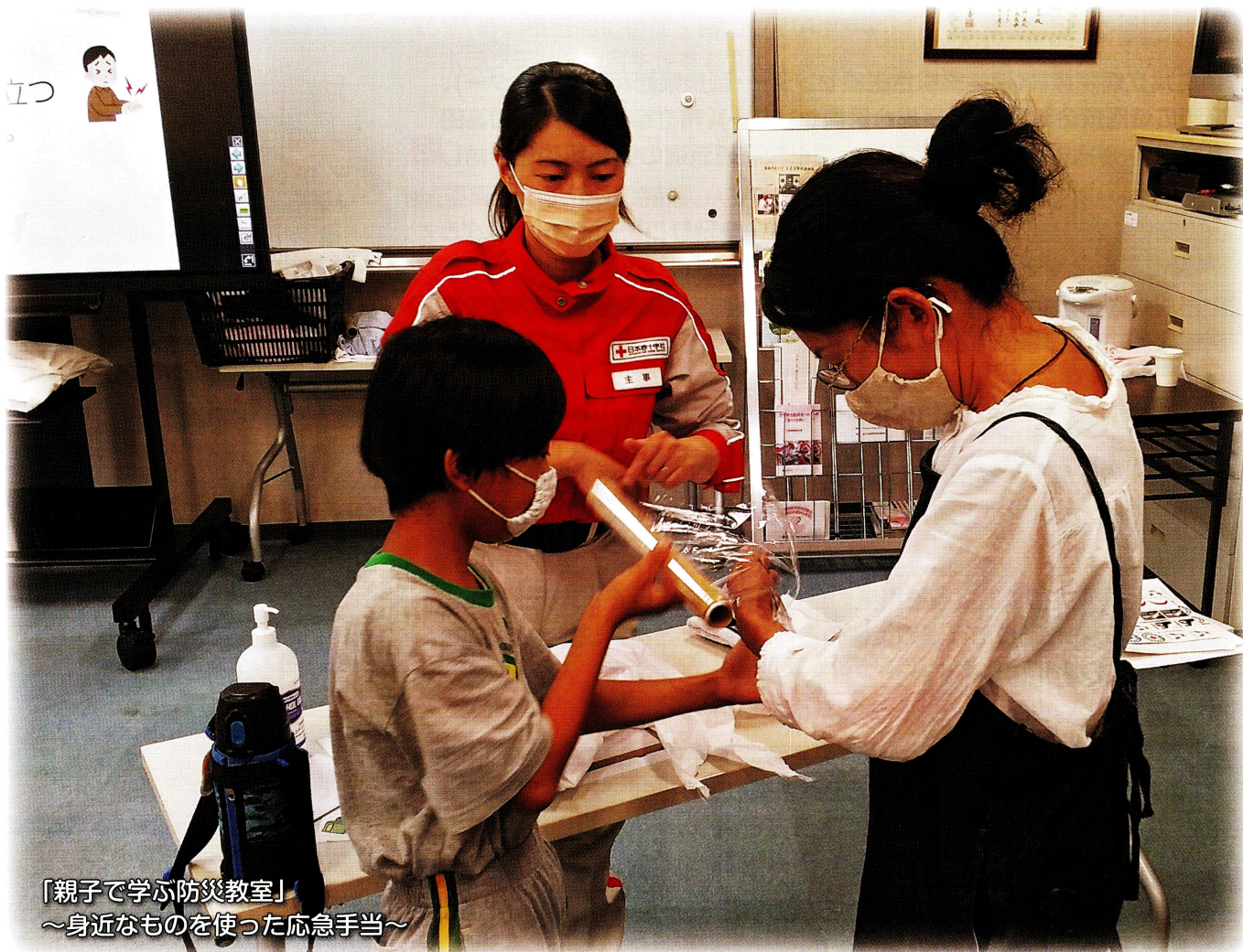
「親子で学ぶ防災教室」 ～身近なものを使った応急手当～

県民のみなさまには、赤十字事業の推進につきまして、日ごろより格別のご協力を賜わり、心から厚くお礼申し上げます。